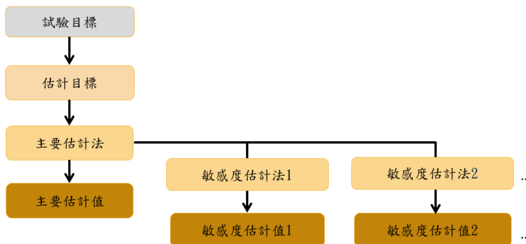
圖一、給定的試驗目標將估計標的、估計方法、及敏感度分析連結一致

試驗的規劃應循序進行 (圖一)。明確的試驗目標應藉由定義適當的估計目標轉化為主要臨床關注的問題。估計目標定義了特定試驗目標下的估計標的 (即「估計什麼」，參見 A.3. 章節)。然後可以選擇一個適當的估計方法 (即分析方法，稱為主要「估計法」，參見辭彙表)(參見 A.5.1. 章節)。主要估計法將以某些假設為基礎，為了探討偏離其基本假設時，主要估計法所得推論的穩健性，須執行一項或多項針對同一估計目標的敏感度分析 (參見 A.5.2. 章節)。